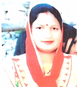
पार्वती देवी सचिव